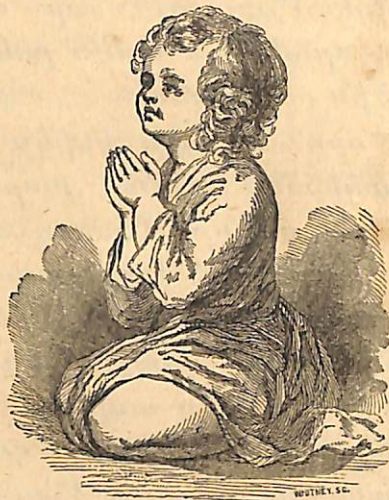
Տերունական աղօթք :

Ո՛վ Հայր մեր՝ որ երկինքն ես, քու անունդ սուրբ ըլլայ . Քու թագաւորութիւնդ զայ , քու կամքդ ըլլայ , ինչպէս որ եր- կինքը՝ անանկ ալ երկրիս վրայ . Մեր ամէն աւուր հացը՝ այսօր մեզի տո՛ւր . Եւ մեզի ներէ՛ մեր