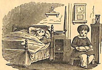
Սարդալու վարժութիւններ :

ո՞ր տեղ է զով օղ է ե՞րբ զամ ես ո՞ր թագ է լաւ երգ է թան է ատ