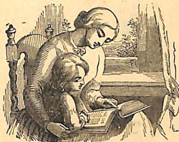
Գիր սորվելու վարժութիւններ :