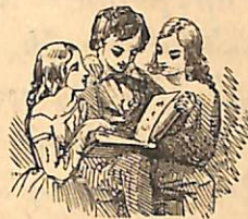
Վարդալու վարժուի խննդ :

Գրիչ մը տո՛ւր ինձի որ դասըս գրեմ : Ծախու գօ- տի կա՛յ քովդ . աղուոր հատ մը կ'ուզեմ ես : Սուր դանակ է ատ . զգոյշ եղի՛ր որ ձեռ- քըդ չը կտրես : Այսօր ճաշը դողում ե բրինձ պիտի ըլ- լայ : Դ՛գալ մը դեղ խմէ՛ որ հիւանդ չըլլաս : Աեղի է, չեմ ուզեր :