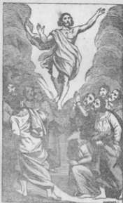
Էջ Ի բրգին Կ. Քանու. սրբու. Կա Ի Յն. Կ Կոնյ :