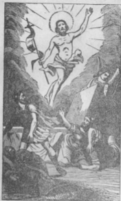
Գրքում. Գրքում եւ. ցրո. կոստ. անկեղի Իշխովի կոստ. :