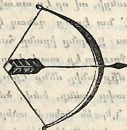
Իջնում է վարագոյնը.)

յետոյ Միբուկը — ուսին դրած մի կացին: ապա Պէդօն — վիզը քցած մի հանկարէնք, իսկ դլտին, զղակի վրա — մի պուլիկ Ամենրի (այսրելոց յետոյ պարուս է եւ Պէդօն: Այս միջոցին ոխերիմ Բոնիկն ծածուկ առնում է Միբուկից կացինը եւ ժօտնետով կացնի բուլտով խլիւում է Պէդօնի գլխին դրած պուլիկին: Պուլիկը կոտորվելով շքջանակը ընկնում է Պէդօնի վիզը, որը իզուր աշխատում է հանել, բայց չէ կարողանում, ուստի դռնում է անճարացած.) Երբեք, զքախ, թաքաւորըն ապրած կենա, մեռա... (Փողոսարները լռում են.) ԲՈՒՍԻԿԵՆ. (Հեղօրէն.) Այի, դու բու պատիճը հտայար... ՏՈՒՍԻԿԵՆ. (Հրամայողարար.) Բոնիկին դու դառա... (Շքջանակ սեղով կապում են Բոնիկին, որը շիզիկնի բարինս ասելով դուրս է գնում.) ՊԷԴՕՆ. (Շքջանակը ընկնում է բերանը.) Վայ նախի ջան... Իրեք կրորթութիւնը թմամեց... ՏՅ, էս ինչ ԴԱՎԻ — ԴԱՌԱՐԱՔ Էր... Վայ ըսէլմաէլա