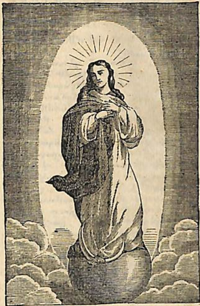
ՎԵՐԱՓՈԹՈՒՄԸ Ս. ԱՍՏՈՒԱԾԱԾՆԻ: