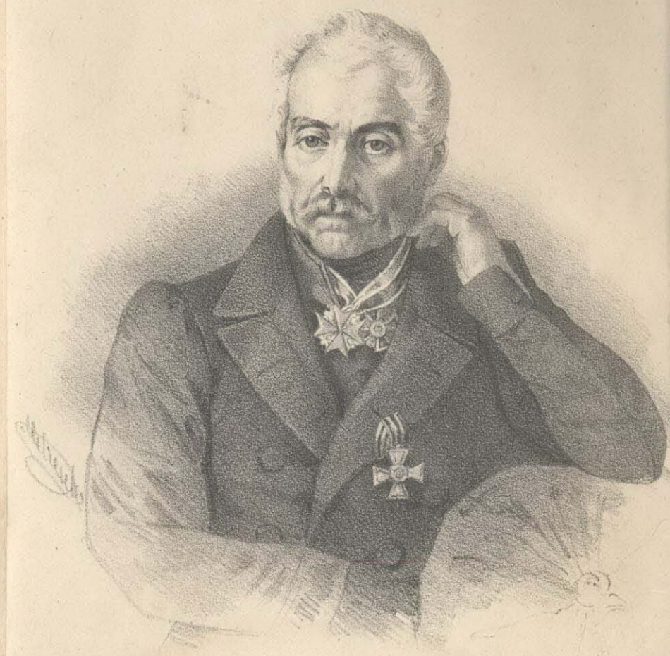
Генералъ Майоръ Павелъ Мелицкий