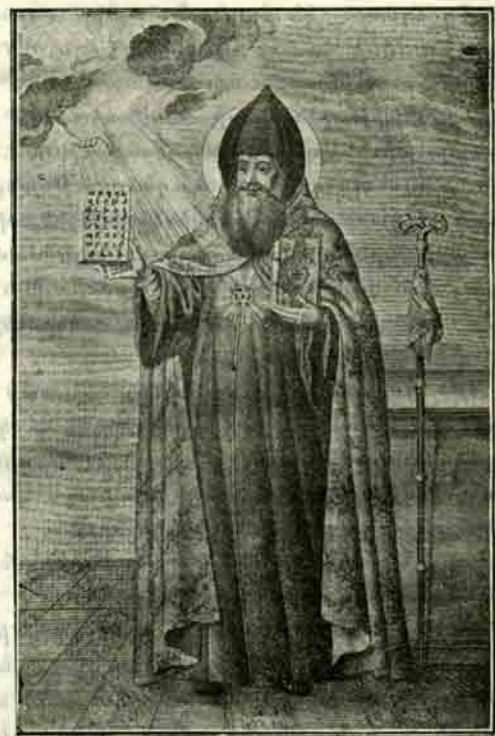
Սր. Մեսրոպ Մաշտոց

Այսօր տօնուում է հայկական տառերի գիւտի 1500 ամեակը և սպազորութեան խօսքի 400-ամեակը: Անշուշտ բոլորս էլ ծանօթ ենք մի պատմութեան այդ փայլուն էջերին, գիտենք և ճանաչում ենք ս. Մեսրոպ ու Սահակին, Աբգար դպրին, բայց թող մեզ ներուի այսօր կրկին վերյիշելու այդ նշանաւոր ու մեծ մարդոց անցեալը, տալու այստեղ նրանց մասին կենսագրական՝ թէկուզ շատ համառօտ նկարագիրը: Չէ որ այսօրուան յօրելեարները նրանք են: