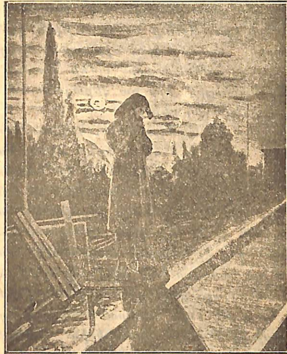
Նկար Տ. Մանգլիճէի

Մարիամը, Կացիայի մեծ աղջիկը, այս գրոյցի ժամանակ ներսից, դռան մօտ կանգնած, լսում էր ծնողների խօսակցութիւնը: Նա 10—11 տարեկան մի թուխ, գեղեցիկ ու գրաւիչ դէմքով աղջիկ էր, որին աւելի հրապուրիչ էին դարձնում նրա խոշոր ու սև աչքերը: Նրա հագի չթէ նեղ վերնազգեստը շատ հնանալուց դոյնը կորցրել էր և այնքան մաշուել, որ պատառուածքներից նրկատուում էր նրա մարմնի մերկութիւնը: Ամօթից՝ մինչև