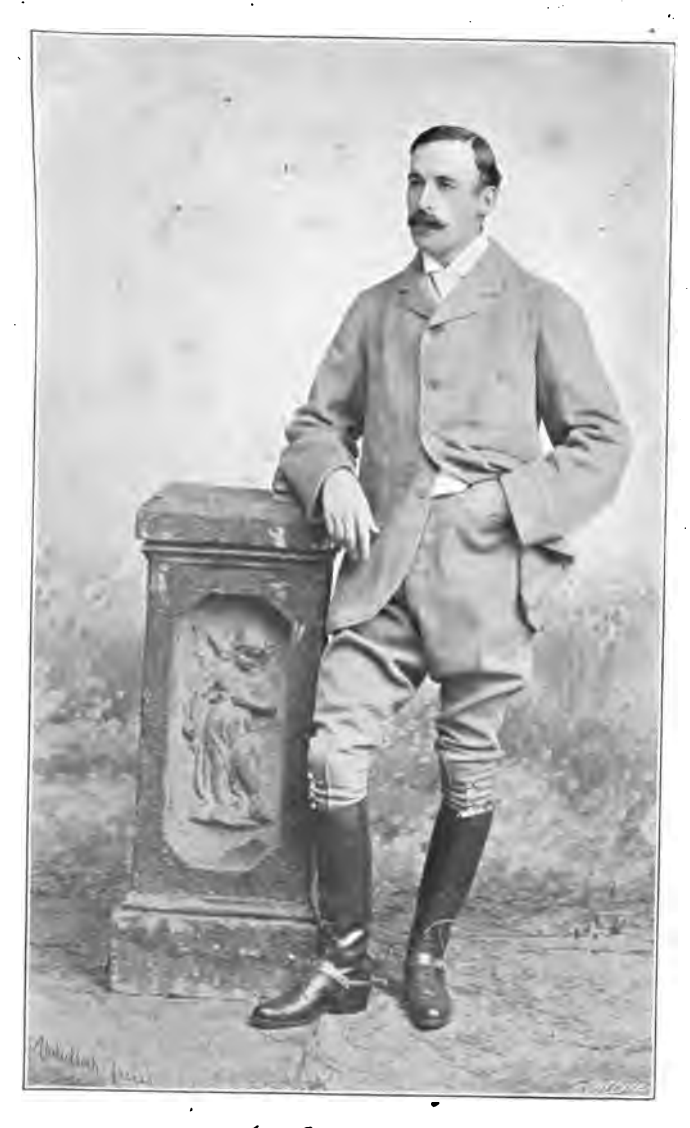
Հ․ Ֆ․ Բ․ ԼԻՆՉ ՀԱՅԱՍՏԱՆԻ ՈՒՂԵՒՈՐԱԿԱՆ ՀԱԳՈՒՍՏՈՎ