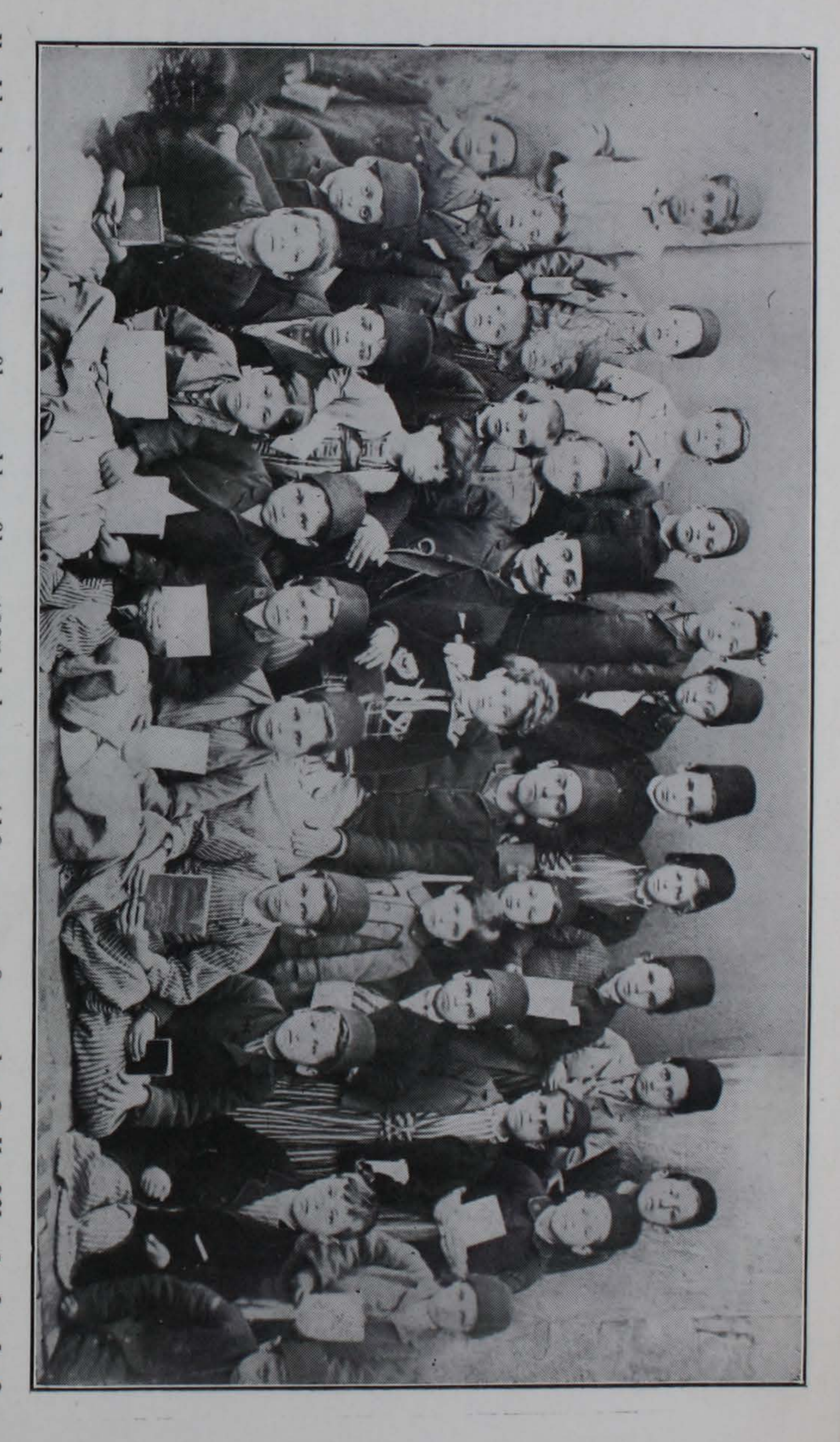
փրակոսի վարժարանի աշակերտները 1895-ի կոտորածէն · 8mum Urnurgh 8ովհաննէս Bangumpan