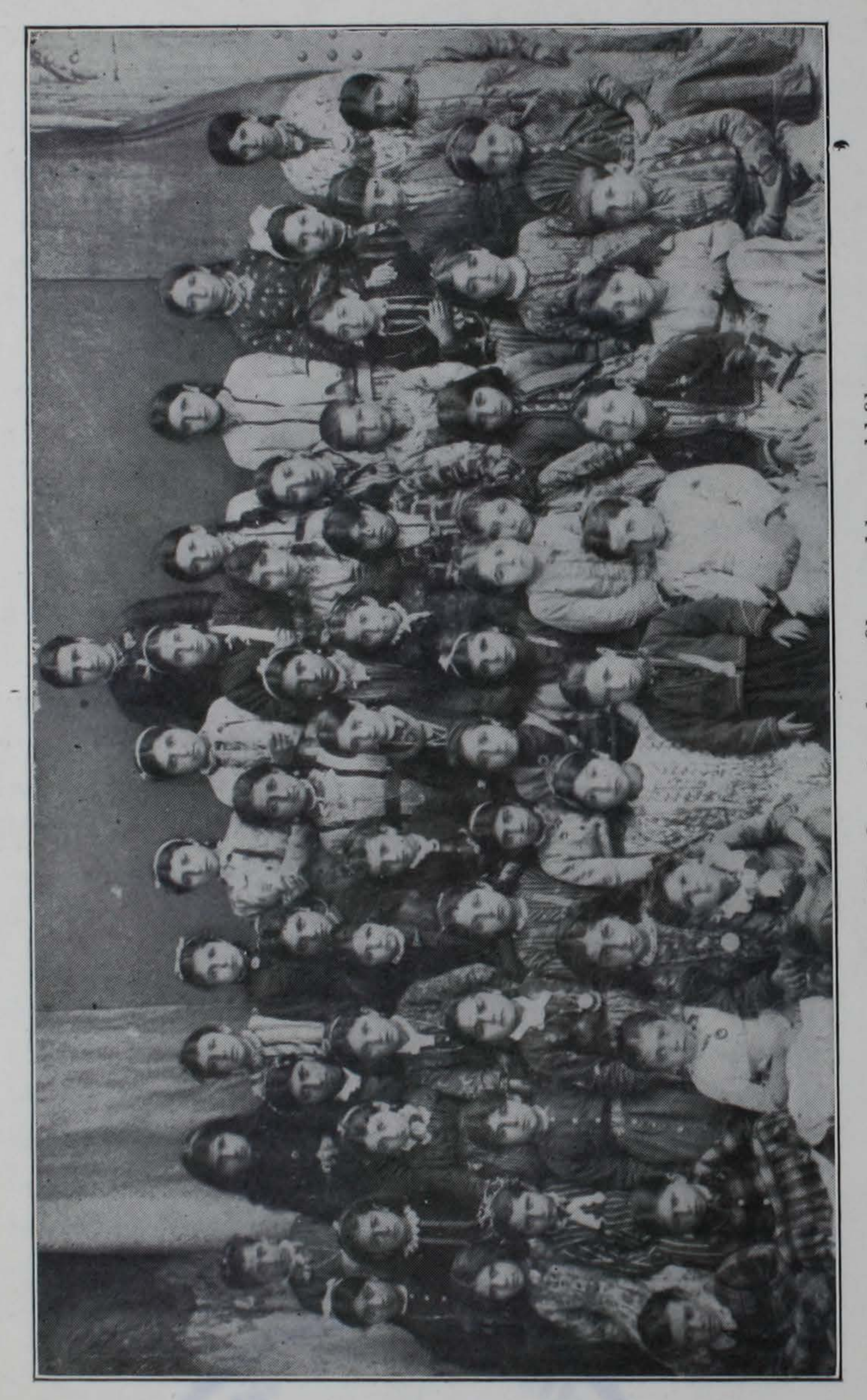
Լուսաւորչանկանաց Վարժարանի աշակերտուհիները