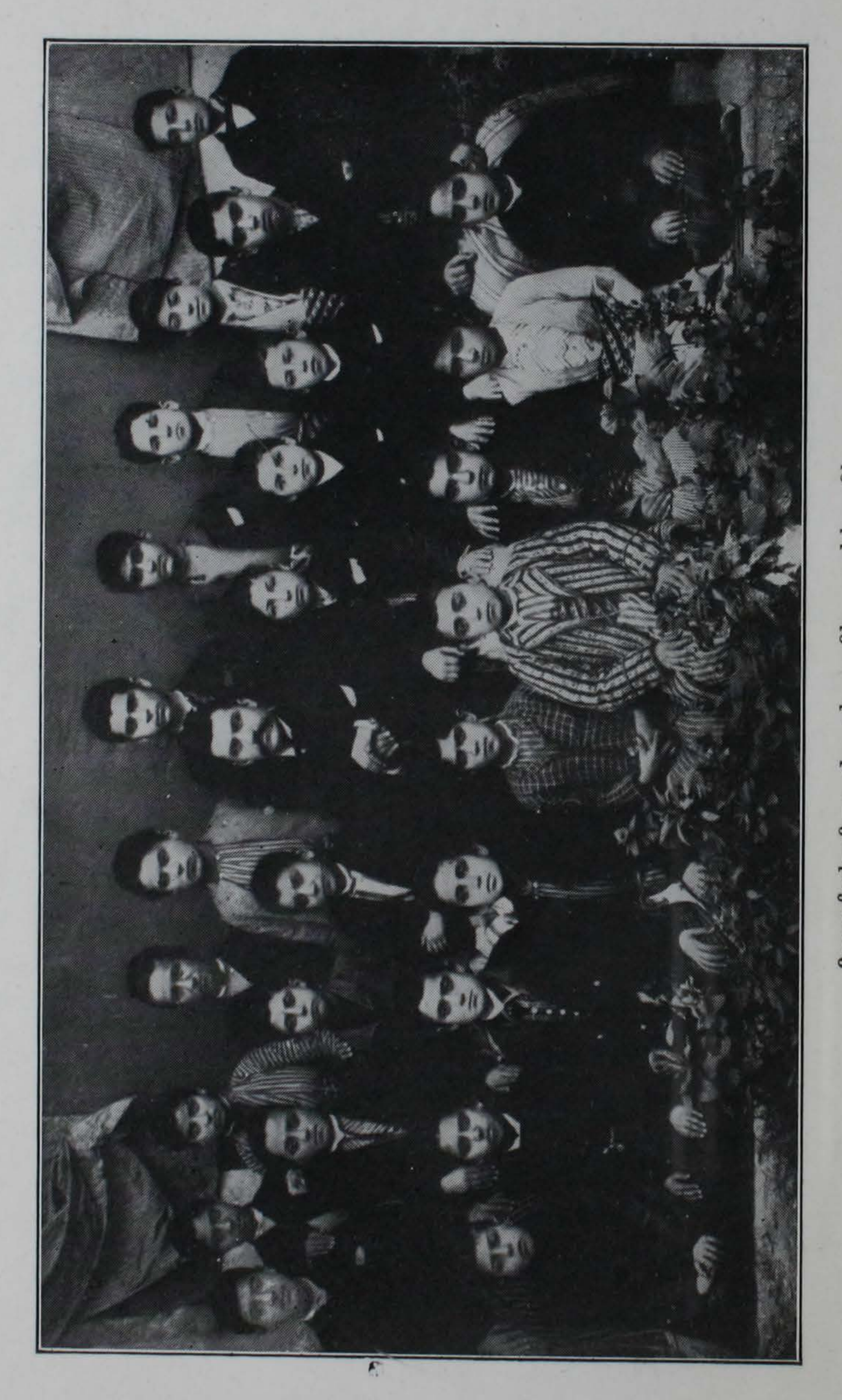
Բողոքականաց Վարժարանի աշակերոները