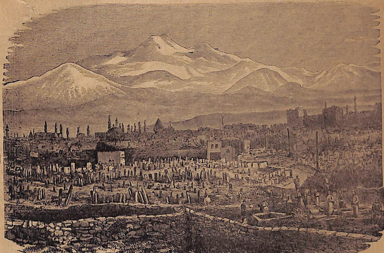
Կ Ե Ս Ա Ր Ի Ա . Գ Ա Յ Ս Է Ր Ի Յ Է

Ինտի պու գօճա պաշըլարըն ահվար տէհէթ իլթիմալինի պու վէճէլ միւնֆէրիտէն պահա վէ իպահ էթմէնի սօնու