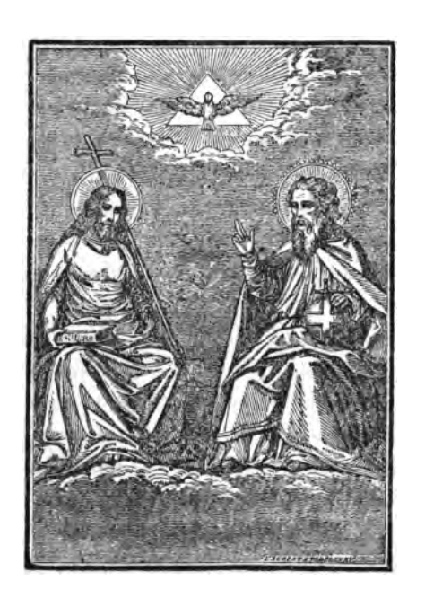
Միո<mark>ժ բնուՌեամբ ԱստուածուՌիւն։</mark>