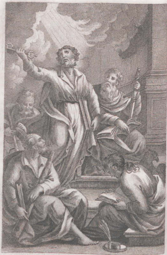
Ն. ա. արեւախան թողնոյ մասե՛նագիրք: