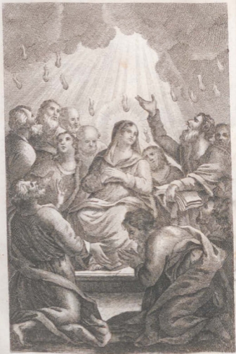
Գալուստ Հոգւոյն Արրոյ: