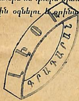
Ե, Վ. Ք.

Եղբայրներս վեշտասաներորդ դարուն բարե- կարգուած Քրիստոնեայք մեր շուրջը կեցած են, անոնք պապական հանգանակները և Աւետարանին համաձայն ինչ որ կար պապական եկեղեցւոյն մէջ, զանոնք առին ու դուրս եյան: Ասիկայ բաւական է մեր Ազգին օգնելու և գրինակ ըլլալու: