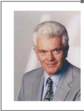
ԿՈՆՖԳԱՆԳ ԼՈՒՀ (Թրիբի համալսարան)