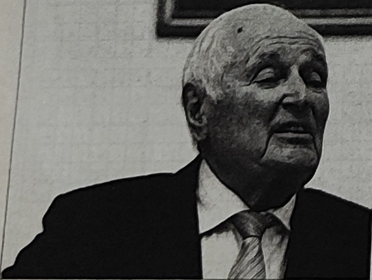
Վլադիմիր Բարուդյանի ֆոտոգրաֆը © PHOTOMEDIA PRO

– Պարոն Բարիսուդարյան, արդեն երկու տասնամյակ է՝ Հայաստանն անկախ պետություն է, ինչը եայազեմներին հնարավորություն է տվել նորովի լուսարանել հայոց պատմության շատ ու շատ կնճռոտ հարցեր: Այսօր ինչպիսի՞ն է մեր ժողովրդի հետաքրքրությունն իր անցյալի նկատմամբ: