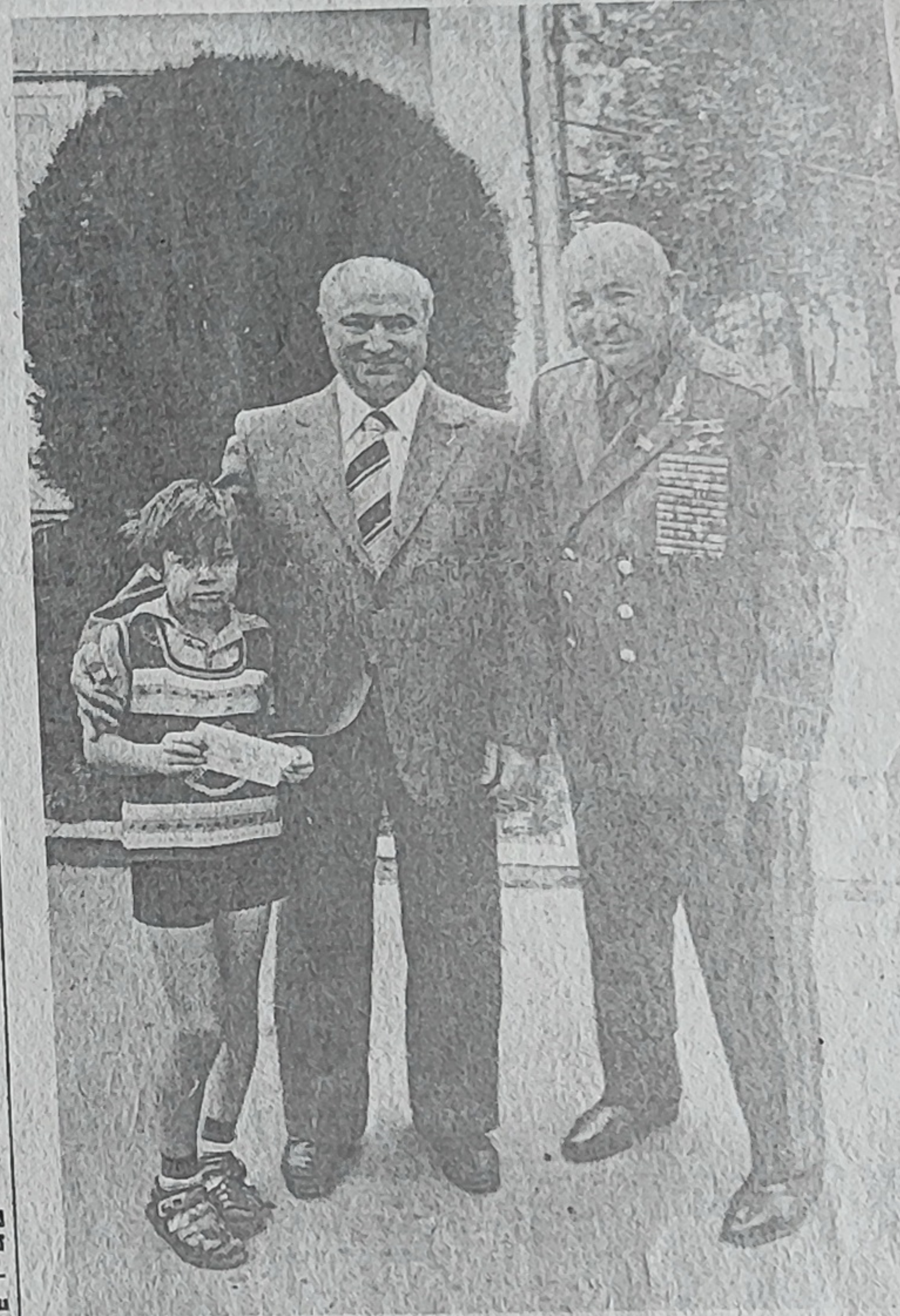
Մարշալ Հովհաննես Բաղրամյանի հետ: