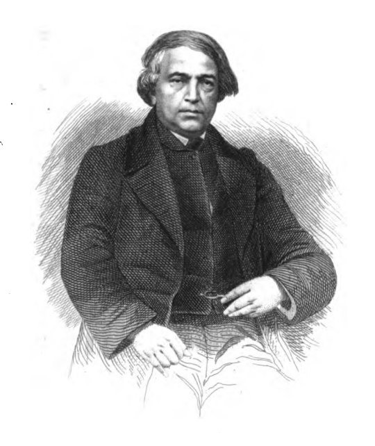
TPPNP MUSULTEULS CRÉCOIRE CONSTANT

Paris Imp Bréhier fr v S! Andre des arts. 37