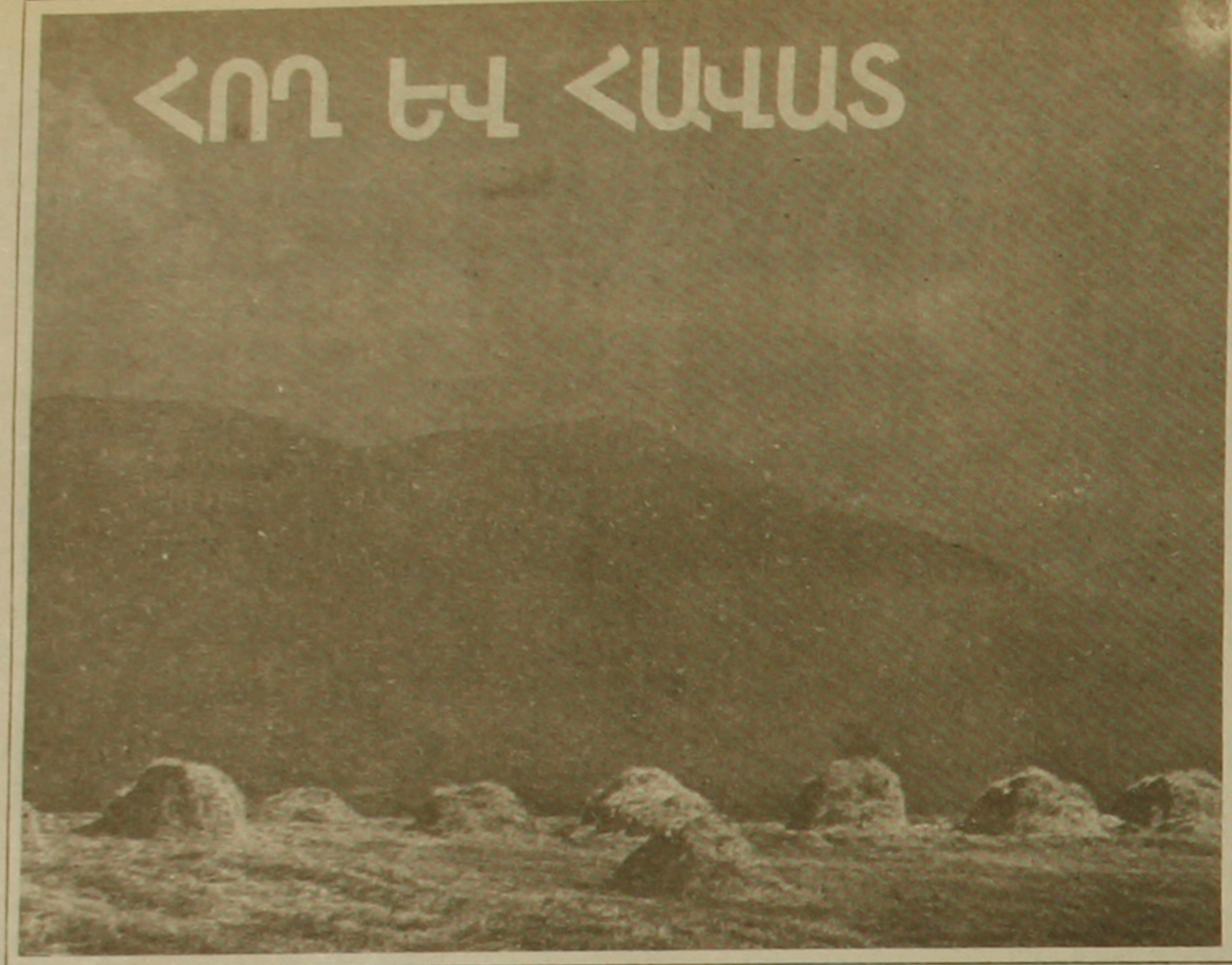
Լուսավորող՝ ԳԱԳԻԿ ՀԱՐՈՒԹՅՈՒՆՅԱՆԻ