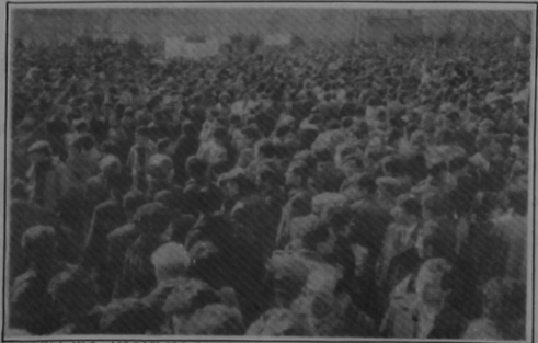
ԵՐԵՎԱՆԻ ՄԷՋ, ԺՈՂՈՎՈՒՐԸ ՂԱՐԱԲԱՂԸ ԿԸ ՊԱՀԱՆՋԷ

Անսպասելի սպանություններ տեղի ունեցան Ատրպեյճանի այն ֆաղաֆներուն ու շրջաններուն մէջ, ուր հայ ազգաբնակչութիւն գոյութիւն ունի: Հակազդելու համար Հայաստանի եւ Ղարաբաղի մէջ տեղի ունեցող խաղաղ ցոյցերուն, ժողովուրդի թշնամիները դիմեցին իրենց անանդական գործնականերպին՝ ոճիւրներու: Արտասահման հասնող լուրերու համաձայն, զոհերու թիւը շատ անելի բարձր է քան պաշտօնապէս յայտարարուածը: Մեր երրորդ էջին վրայ լոյս տեսած ԿՐՕՆԱՄՈՒՆԵՐԸ ԿԸ ԽԼՐՏԻՆ խորագիրը կրող յօդուածին մէջ նշուած 33 զոհերը, այսօրուան դրութեամբ, նկատի ունենալ անելի քան հարիւր մարդ: Սպանութիւնները եղած են կազմակերպուած եւ մտածուած: Վիրաւորներուն թիւը նոյնպէս բարձր է. ըստ անգլիական մամուլին անելի քան հազար վիրաւորներ կը գտնուին հիւանդանոցներուն մէջ: Բազմաթիւ հայերու բնակարանները հրոյ