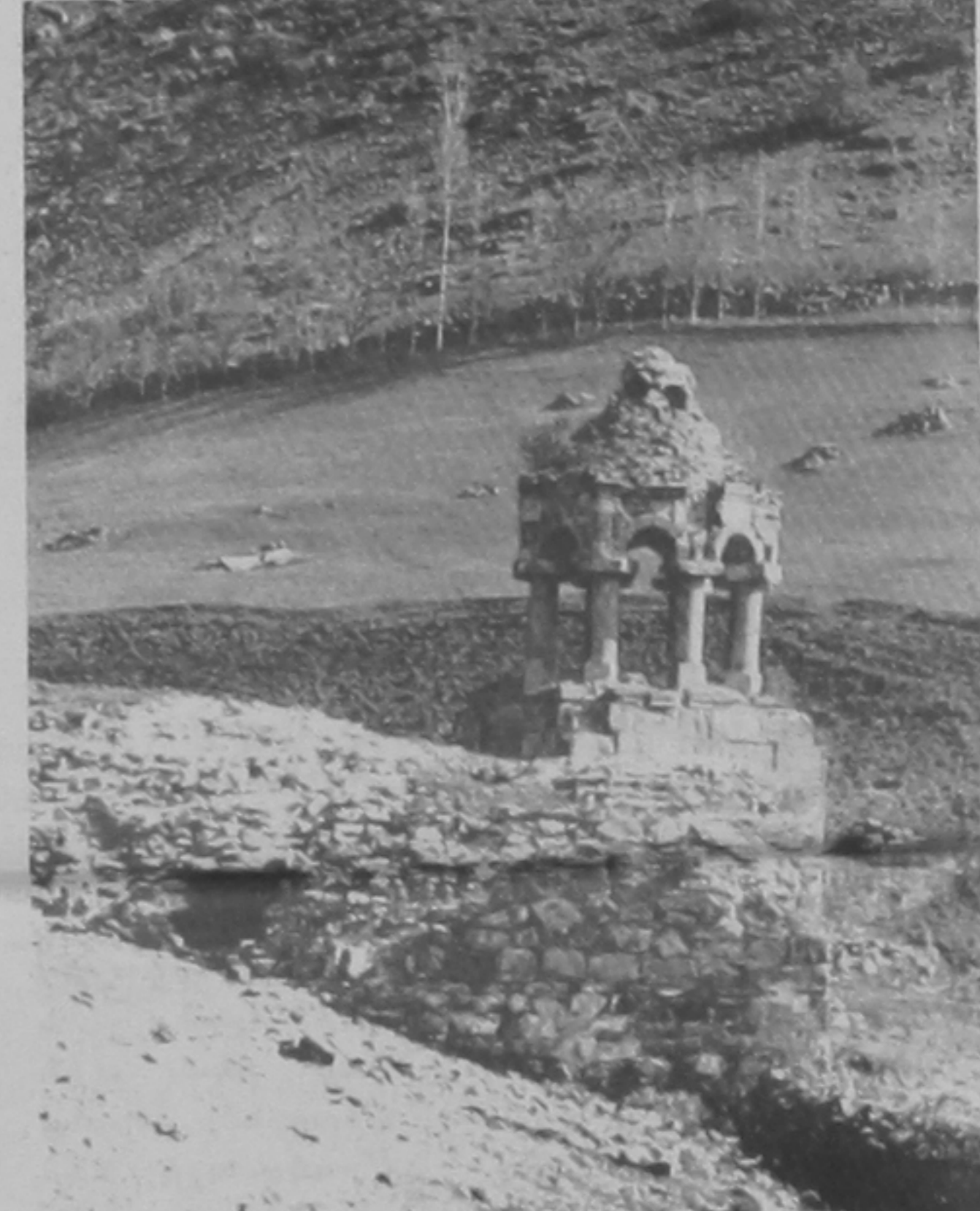
Յաղորդի շրջանի եկեղեցիի մը լուծած աւերակները

Եւ ահա՝ «Ատրպէյճանցի բանաստեղծ-գիտնական մը», Բախտար Վահրգատէ անունով, կը պատգամէ.- «Հնդից բաժին չեմ տայ», իբրեւ պատասխան Հայաստանի եւ հայ ժողովուրդի արդար պահանջին, որ Ղարաբաղը վերադարձուի անոր պատմական իրաւատիրոջ, հայութեան: Յայտնօրէն. անոր մէջ բանականութիւն ու խղճմտանք ամբողջապէս զոհ ինկեր են ցեղասպանի ժառանգական մոլուցքին: Այլապէս՝ ան պիտի անդրադառնար, թէ խարդաւանքն ալ ծիծաղելի ու քրէականը լլալու սահման մը պիտի ունենայ: Եթէ ազերի թուրք բանաստեղծը «Հնդից բաժին չեմ տայ»