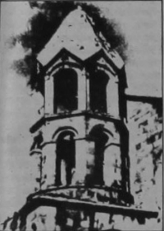
Յղնայի Ա. Աստուածածին վանքի եկեղեցու զանգակատունը (17րդ դ.)

Նախիջեանի Ինքնավար Հանրապետութիւնը գտնուում է հիւսիսային լայնութեան 38° 51' ու 39° 47' եւ արեւելեան երկայնութեան 44° 46' ու 46° 10' միջեւ: Մակերեսը՝ 5, 24 հազ. քառ. կմ է կամ ներկայ Ադրբեջանի տարածքի 6,15: Միջին բարձրութիւնը՝ 1400մ է, նուազագոյնը՝ 600մ: Տարբերիչ բնական առանձնապատկանքներն են կլիմայի չորութիւնը եւ տարածքի բարձր մեկուսացումը: Ատորի կը փորձենք դիտարկել Նախիջեանի Ինքնավար Հանրապետութեան աշխարհաքաղաքական միայն մի քանի բնութագրերը, մասնատրապէս տարածքի վարչական կառուցումը, տարաբնակեցման համակարգն ու փոփոխման միտումները, ջրային եւ հողային պաշարները: