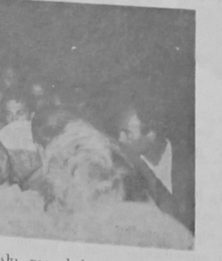
Կը վիհին, կը քննարկեն միմեկի ուր գիշեր...

Նախագահը երկար կը մընայ Սաչիկին քոյ: Չի կըրնար տարհամոզել սակայն: Ապա, կը բարձրանայ աստիճաններէն ու կը մօտենայ բարձրախօսին: Անոր առաջին խօսքերը կը խառնան սուլոցներու ազդեցիկն մէջ: Հետզհետէ սակայն լսելի կը դառնան հատիկ-հատիկ արտասանուող բառերը, հանդարտ, անկիւր, առանց հոհատրականութեան: Կը բացատրէ ան, թէ երեսփոխանական թափուտ աթոռներու թեկնածուներէն ոչ ոք կըրցած է հաւաքել քուէներուն անհրաժեշտ՝ 51 առ հարիւրի մեծամասնութիւնը: Ապա, սուլոցներու նոր տարափին կան օրէնքով ոչ թէ քուէնետակ կ'աւելցնէ, թէ ընտրութիւնը պարզ համեմատութիւնը