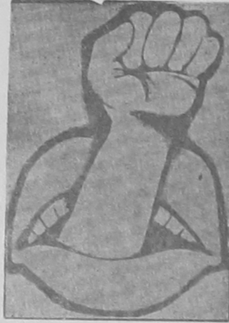
«Միացում» կը գոռակոչուի քաղաքի բերանները

Ժողովուրդը, որ երևանեան չափանիշերով այնքան ալ բազմամարդ է այսօր,