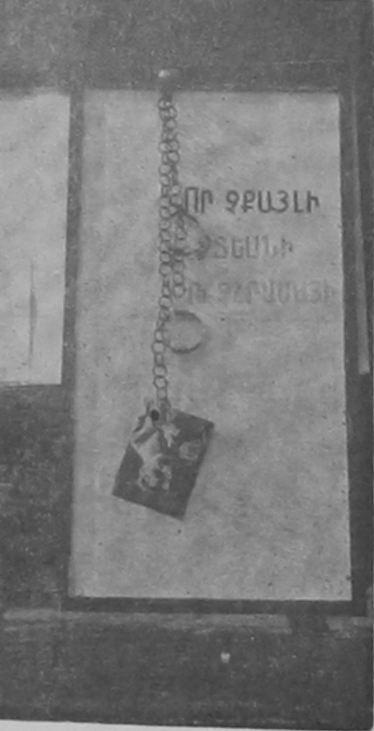
Ստալինը շղթաներով գլխիվայր կախուած...

հազիւ 7-8 հազար հոգի, կը լարուի, կը յառաջանայ դէպի Օփերայի աստիճանները, ուր տեղադրուած են բարձրախօսն ու ամպլոնը: Իսկական բեմահարթակ կը յիշեցնէ շէնքին այդ մասը, ետեւը՝ շէնքին ճակատը՝ անհրաժեշտ տեքստերով: Առաջին հերթին, հոն մեր ուշադրութիւնը կը գրաւէ եռագոյն դրօշակը, որուն կողքին, աւելի մեծ չափով, պատասա մը՝ Ծառուկեանի «Թուղթ առ երևան»-էն ծանօթ հատուածով («Արիւնից ծորած երիզ մի կարմիր...»): Անկէ բարձր, շէնքին ճակատին, տեղադրուած է, իբրև «իրկութեան լաստ», եռագոյն ներկուած՝ քառակուսի անի մը, որ այնքան փոքր է լայնադիր պատին վրայ, որ գիտողին մօտ տարակուսանք կ'արթնցնէ: