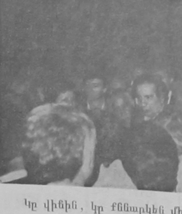
Կը վիհին, կը քննարկեն միմեկի ուր գիշեր...

դային դրօշը»: Եւ այժմ ան կուղէ, հետեւողութեամբ լաթվիացիներու, որոնց եռագոյնը իսկապէս եօթը դա-