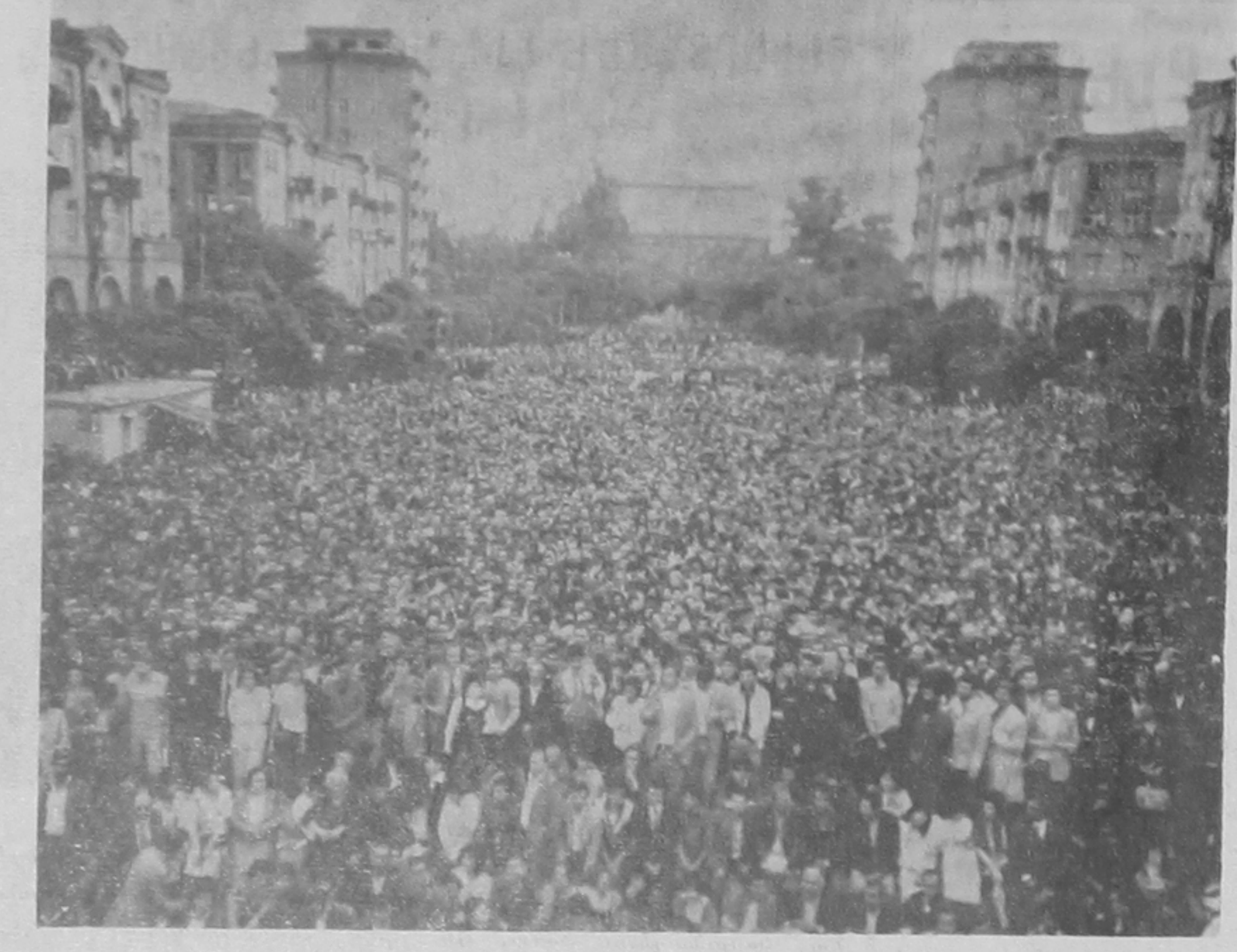
Ղամբարայի ճարային ճաւաք՝ թուանեանի գրասարդին մէջ:

ընէ ինզրեց տունըը ցրու ճանաւանղ որ ճամբ 11ին պիտ կրկնուէր Պարոյիթի ճարգարը: Եւ անէն ճարգ, խաղաղ կարգապահ, ցրուեցաւ տունըը: ՄԱՅԻՍԻԿԱՆ ՃԵՐԹԻ ՊԱՆՈՒՆ Այս տարի Երևանի Մայիս ճէկան ճերթը ճոյնպէս ապա Ղարաբաղեան կարգապահութիւնը: Մայրաքաղաքի զլխար-