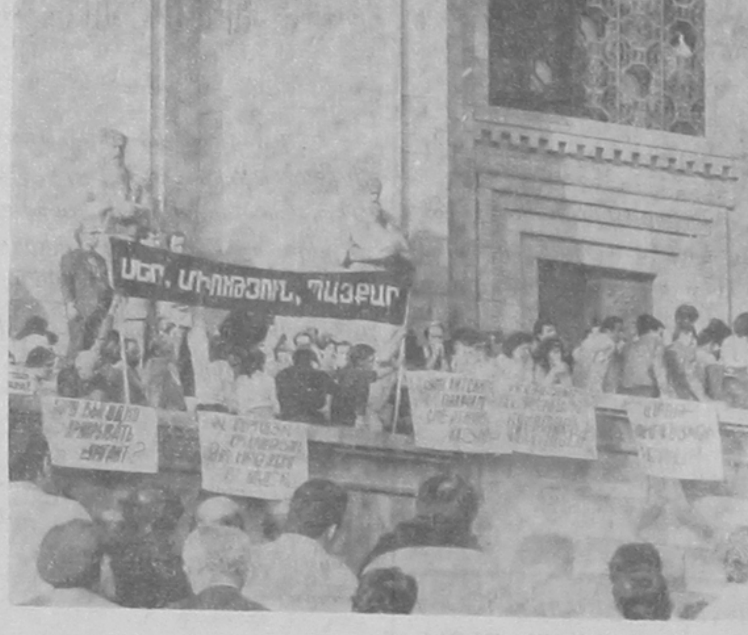
Մտանաղարանին աղցն: Ղայերին պատաններու կըզին կարիի է կարդալ ուտանին պատաններ, ուր է «Որո՞ւ համար ճնտանու է Սուսկոյիթը ճամկեր»:

ստարտանաուանը կը վարանային որ, սարտկէ ճանցիք այլ ճնայք-թոյ գրգարութիւն (փարպիւս-ցիա) ստեղճեն, Ղարտարանի սաճանակին ներս: Օրինակ՝ ճարճարում գորճը, անը վրայ, այպ մեղաղըլ ճարերը, ևն: