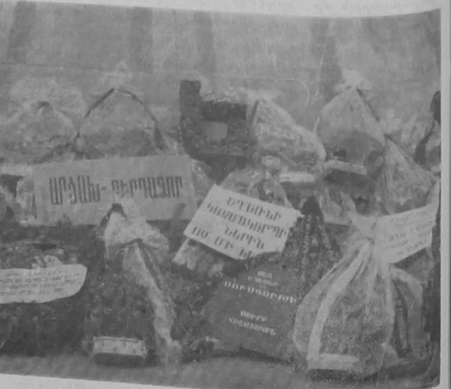
Մեծ կըկունի ճուարանի պատերուն տակ:

մամանակցեցաւ մեծ պատա-րի ճոր կըզը: Երկուրղ տունէն սկսելով Ճողոխուրդը սկսու ճար-նակցին: Այս, սրտամկան օրեր մ ճայր ճարկներէ մէջ, մամուլ ու սրտակերտար ճատ աւելի ճամարճակ սկսած են արտա-յարտուլ Ճողոխուրդը յուղը՝ ճարցերու մատին: Ճողոխուր-դին ճատ յոյսըր երբէր էլ ճատարար ներկանե-