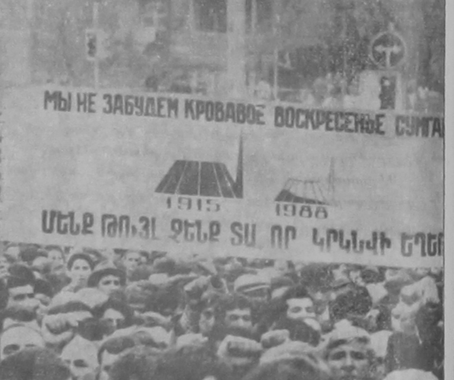
Դեպի Միճեու կարբը: թուաներին վերտաուարինը կ'ընէ «Մեմք ճնմք մտանար Մուսկոյիթի արիւնտ կիրակին»:

Ղարաբաղին ճոր ճամանց գը-փողոցներէն և կըլրունակ-րող ճը՝ Գորդէն Գարբիլեան: Ողջոյն բերու ան Արցախի ճո-ղոխուրդէն՝ մայր ճատունին: Լսու թէ Ղարաբաղի մէջ ցոյց-եր ու գորճարու կը կատարուի, որովճետե ամտուն 11ին Ճուղի մէջ 6 թուրքեր ճարջա-րելով սպաննած են ճայ երկ-տասարղ ճը: Այտեղ, ճատար-ում բարճութիւնը պիկարճե-ցաւ: «Արցախ - Ղարաբաղ» վանկարկումը կրկին սաւա-նեցաւ: Գ. Գարբիլեան կըկեց Պետ. ճամարարանը ճոյնպ-