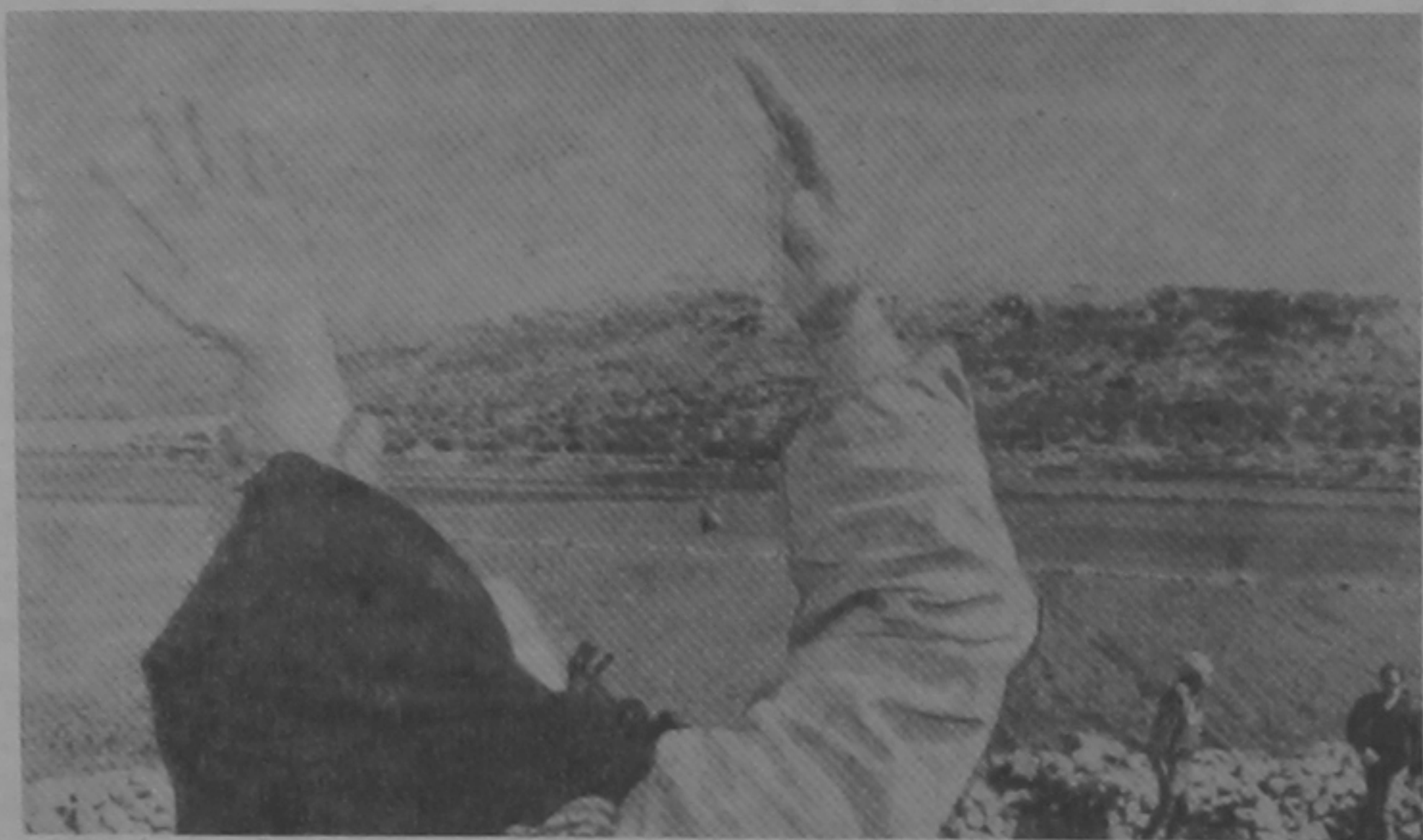
(Начало на 1-й стр.)