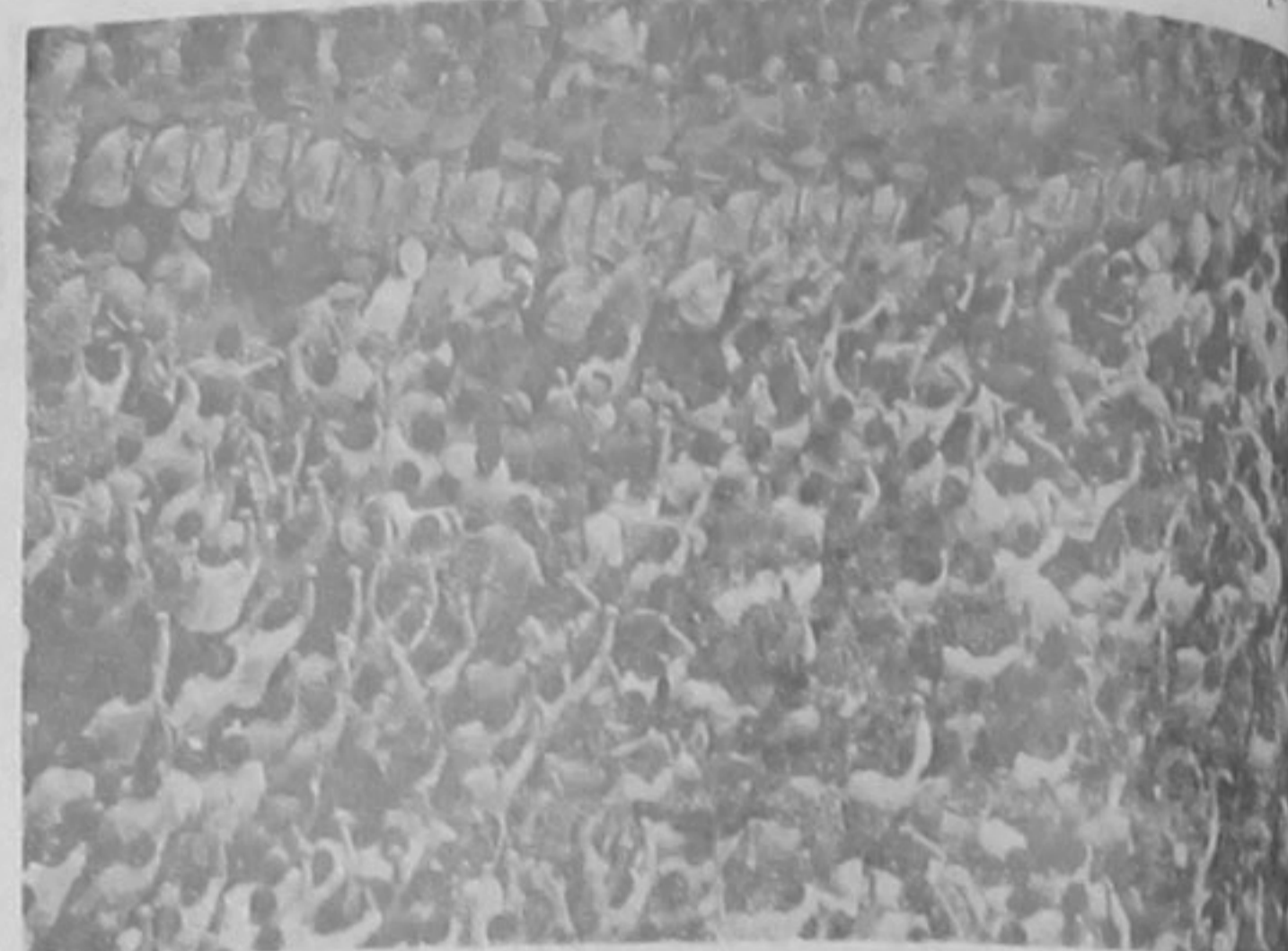
Միլիցիաները՝ բոզոբոզ բազմութեան և բամակայի մեքերու միջեւ...