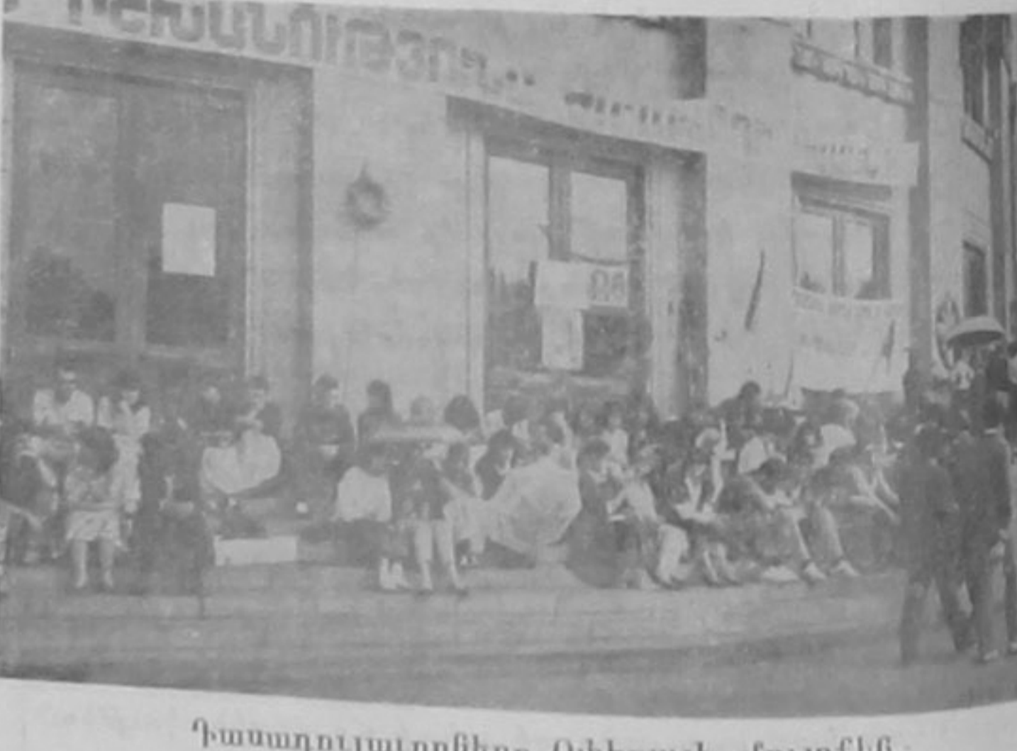
Կառադուլարները Օփերայի մուտքին:

Իսկ կառավարութիւնը այժմ որդեկրօմէ է նոյնիսկ արեւմտեան չափանիշներու համար, գաժանախի յայնա-