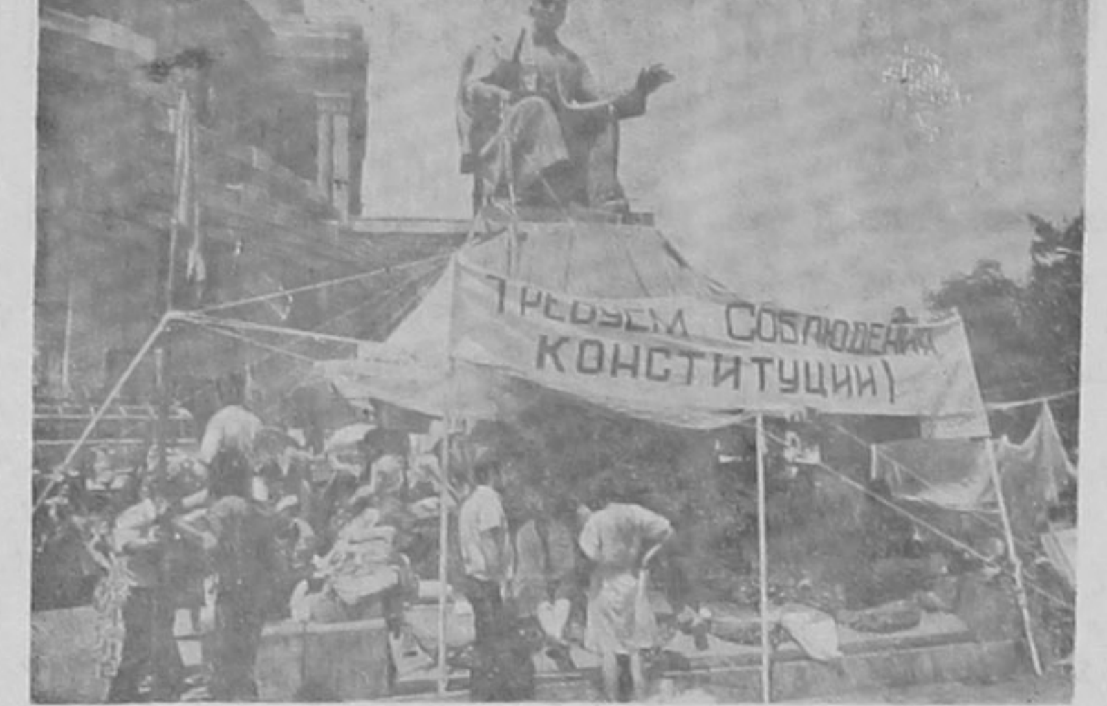
Հացադուլարներ կը պահանջեն Սահմանադրութեան կիրարկումը:

բարադրին վերադառնալով ծննդավայրը և տէր կանխ իր հողին ու տունին: 43 զիշկայ հոն, որոնք լքուած են որոնց բնակիչները գաղթեան դէպի Պարո, Երևան, Մոսկուա, Միլիցիայուտ... Մուսկայի: Պէտք է հուժկու քրաւիլ օրեր, որպէսզի ճամբայ բանաւ Արցախի զիշերուն միջև: Ետարի շարունակ աղբիքներ այնքան ծրագրուած ալետեր են, որ Լեւոնային Ղարապի զիշերուն և աւաներուն միջև ճանապարհները կառուցուել են այնպէս որ զիշէ զիշ երթիք կատարուի միայն աղբիքներու իր բնակուած շրջաններուն ըն-