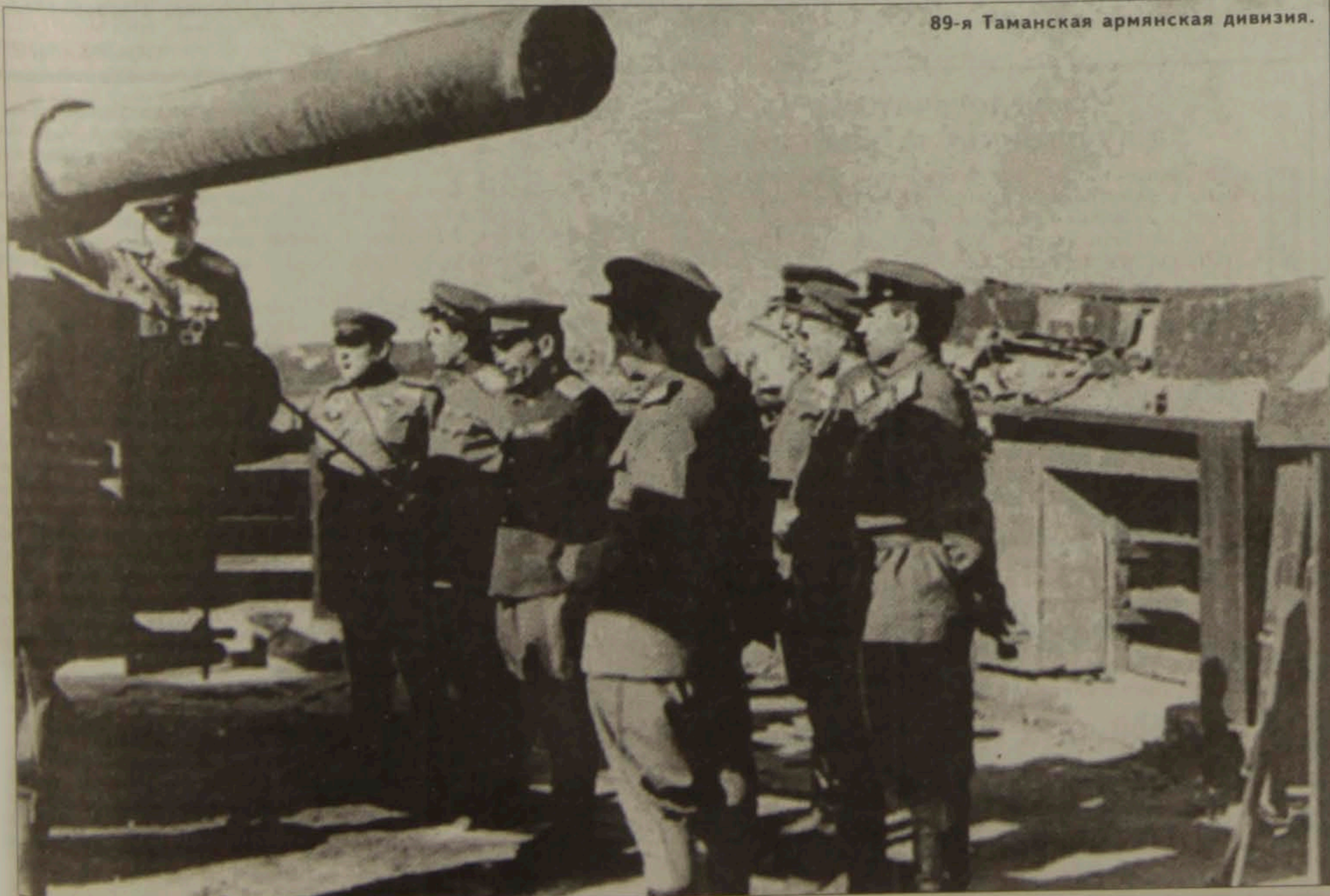
89-я Таманская армянская дивизия.

Распад Советского Союза протекал в атмосфере мощнейшего идеологического давления на пребывающие в процессе трансформации общества. Именно в этот смутный период на асфальте площадей и стала писаться предвзятая история, которая очень скоро легла на первые полосы новой политической периодики. Публикации поглощались взращенной на трафаретном языке не менее предвзятая советской публицистики аудиторией в качестве нового откровения.