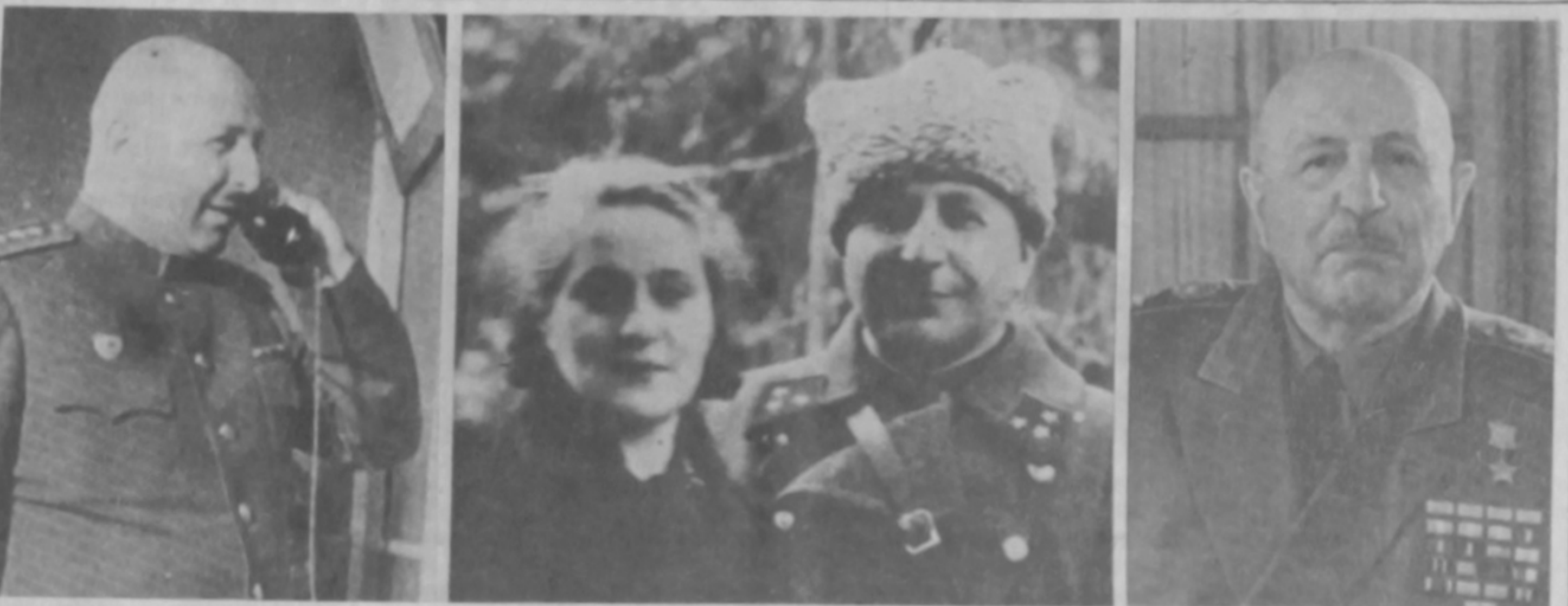
На снимках: (вверху) И. Х. Баграмян на фронте; с женой Тамарой Амалюковной; в кабинете; (внизу) на озере Севви; в Бюракане; в Сардарпате.