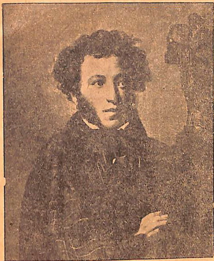
Ա. Ս. ՊՈՒՇԿԻՆ