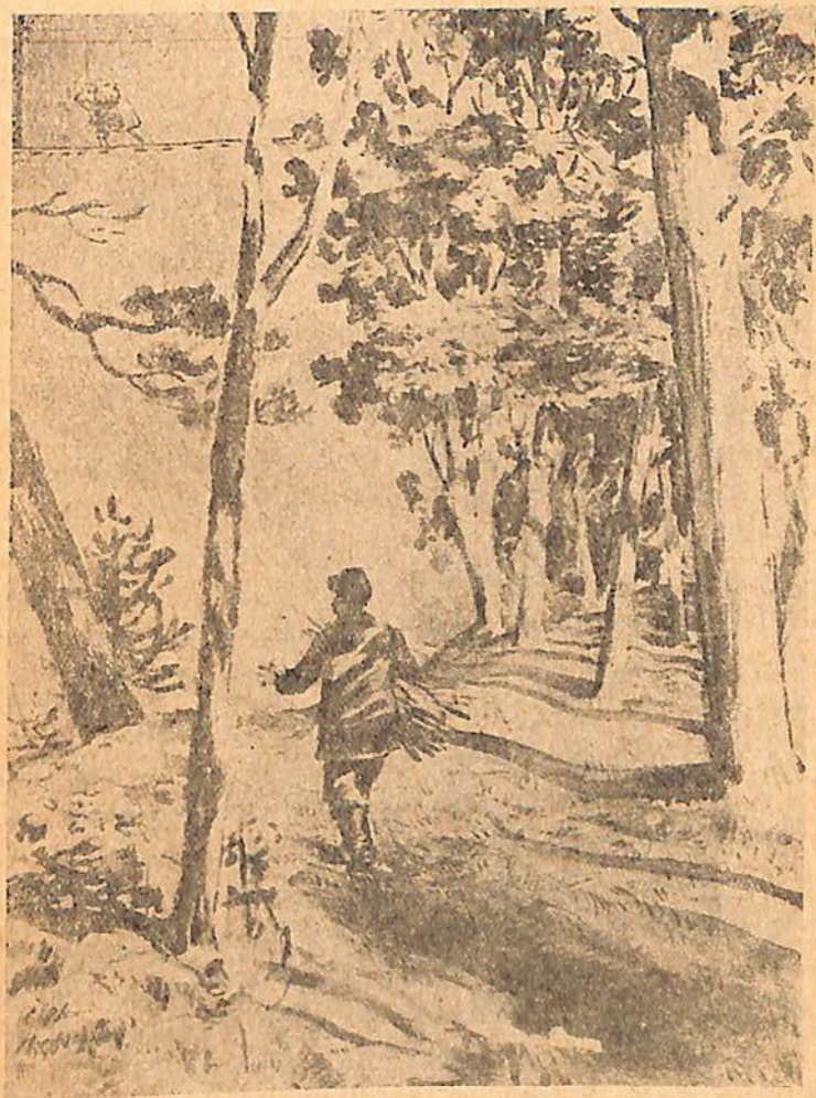
Մրնեց Նեմյոնի աչի առաջր, ուզում է բղավի — չի կարողանում։