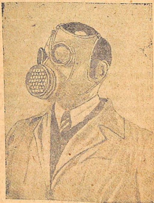
Նկ. 2. Նախազգուշական դիմակ՝ А-10 պրևպարատով աշխատելու ժամանակ

վորն աշխատում է արտահանված հատիկով ընդունվող պարկերի մոտ: Այդ նույն բանվորը կատարում է նաև բունկերի կամ տակառի մեջ թույն լցնելու գործը, իսկ մյուս բանվորները կարող են սահմանափակվել, կապելով միայն քիթը և բերանը թանգիլի կամ բամբակի չոր կապոցով: