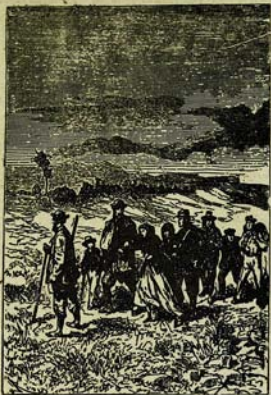
Հանազարհորդուհիմերը հազմածուրյունը հազիվ էյին սրբիում: