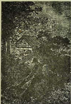
Բժաշկան և գայլենոցան, եւս կառավ Թճարի պարտէր: