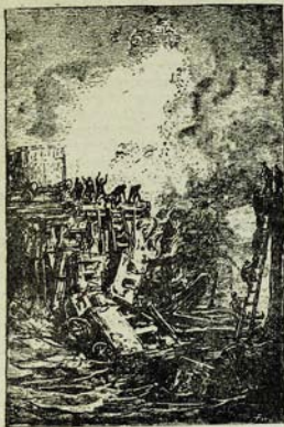
Յերկարակային խորտակում Կալուտան գետի վրա: