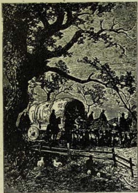
Գլխարկանը ճեկուտի սպանչանը սվեց: