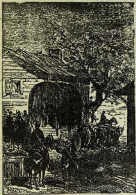
Սեպ Գառ կայանը: