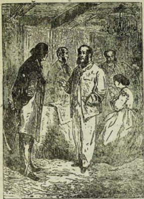
Մոկ-Լորդը հարցախնամ է Գազանի՛ն: