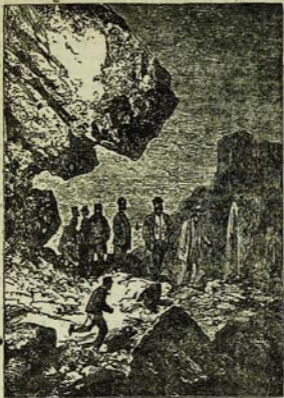
Յւր սպայտները խփում էին գետնի տակից: