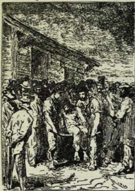
Յեղիւ մտրդ տանում էյին պահակի գիտէր: