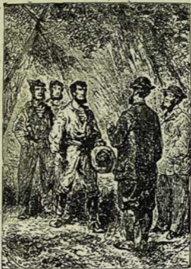
Այստեղ յիկալ Յամուկի հետնից: