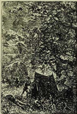
Համազարհուրդները համբար իջնելի իջված փայրանի մաս: