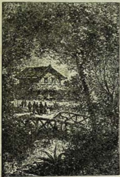
Գառնիկան յերայրենի տնակ: