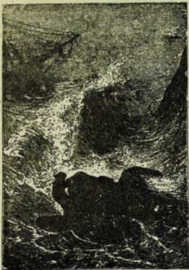
Այն Այստանի մեծ խոտի վրա: