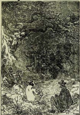
Գարսիպոսները բռնում են ինձ իրար վրա: