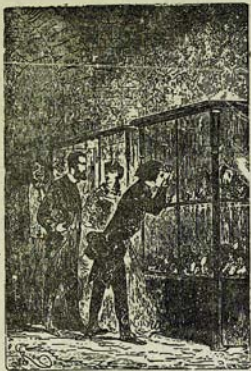
Համազարեղանքը զիտեցին համաբանական բանաստեղծը: