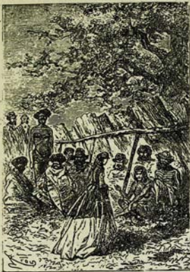
Հանդիպում տեղացիների հետ: