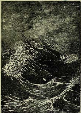
Արհեստը ցանաճով շարժում էլիս հազր: