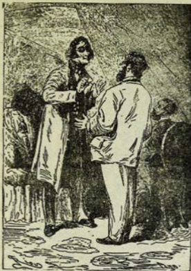
—Տիմոսիանայի միտ կրտսերական էն.— առաջ ժամանակ