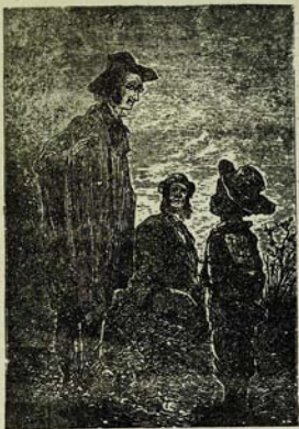
Փարիկ ընկը պատասխանում է Քաղանկին: