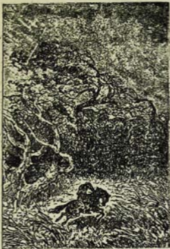
Մշակույթի անհայտացած մրտաբան ճեղ: