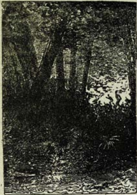
Բոխ-նոսրը գառնից զեռնի վրա և սիսեց անբարձր Յայկ: