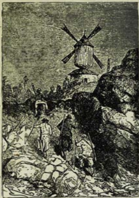
— Ազրի'յ.— բացականչեց Յարկազ: