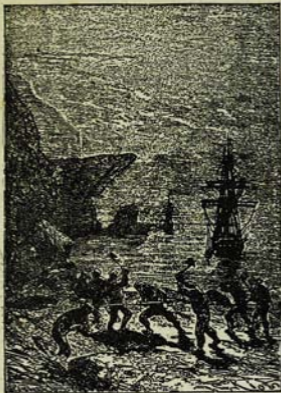
Բնակող զիւրեղ ժոպս ելիմ սնոււմ: