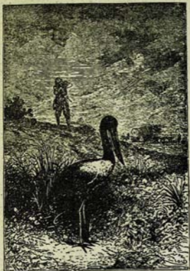
Մայրը կռակի յարկուսի կրո: