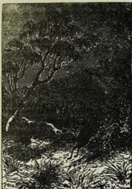
Հին Գրքերի Գրքեր: