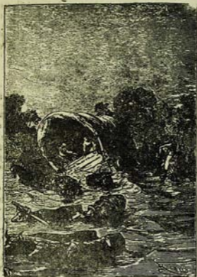
Տարբանք ծովի կողմի վրա: