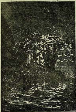
Տեղացիներն Ալբանիին գնդի վերջինը: