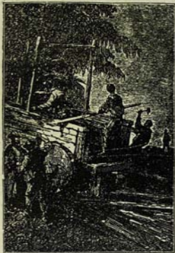
Ճամայարկորդներն սկսեցին պատրաստել փայտեան ուղեվորձնու կամար: