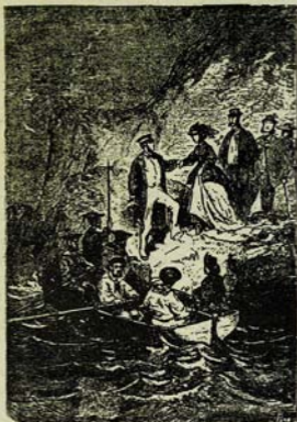
Ուղեւորները վերադարձան Երուսաղեմից հրա: