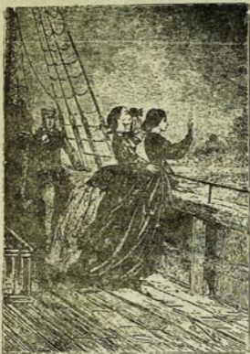
Յելենա և Մերի հեռուստ ելին Տալսիի ժամհարան: