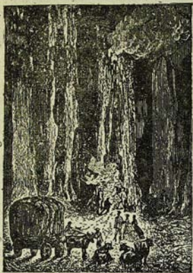
Համազարհարգանքը զազար տան եկեղեցիքի սարքառում: