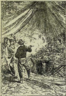
Գործարարները և իրենց ընտանիքները: