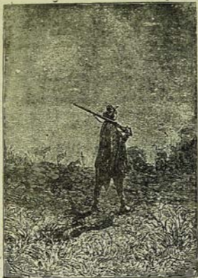
Պաշտմանը պահակ էր կանգնել: