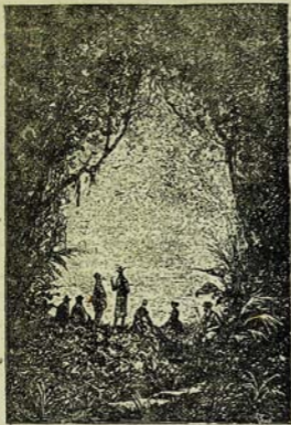
Յիշերը վրա հասավ: