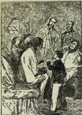
Գարեշուք հարգում է: