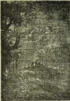
Ատառը լազաց քրի շերտաբնով: