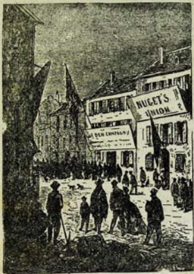
Այսպէս մի խելական տաղաւ կը տննէ: