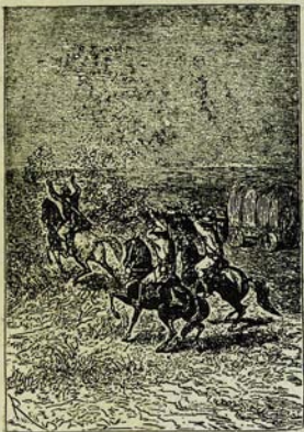
Մտածենք կրածքն ամառափորդներն: