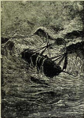
Բազմաթիվ սամանի շնչիկի մի կաթի վրա: