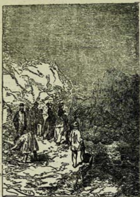
Հանապետները քափառում են ին ժայռու տփին: