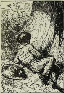
Մեքսիկայի մեքսիկացիները կտրում են: