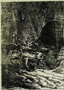
Հարկուն իրեն ցնի Գլ: