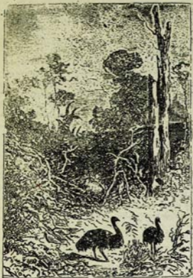
Ameghin's map 1