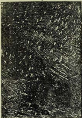
Համադարձությամբ կարկուտի սակ շնկան: